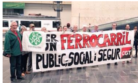
Estación de Zaragoza Delicias