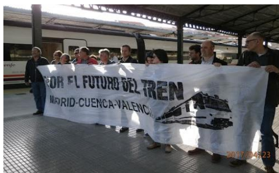
Estación de Cuenca