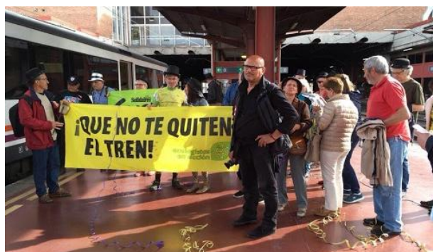
Estación de Madrid Chamartín