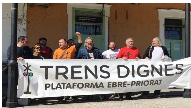
Estación de Mora la Nova