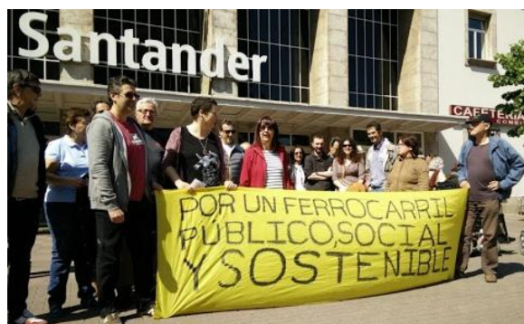
Estación de Santander

Por una red de trenes públicos, sociales y sostenibles