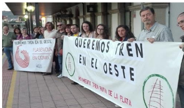
Estación de Plasencia