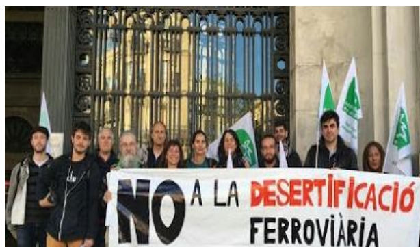
Barcelona Estación de Francia