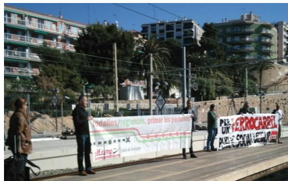
Estación de Tarragona